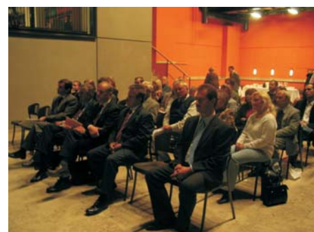
Blick auf das Auditorium