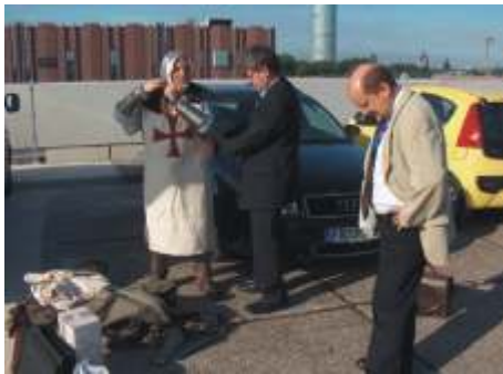
Vorbereitung eines Messtages - Der Ritter wird angezogen.